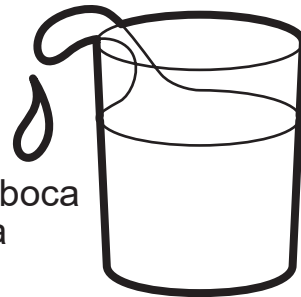
Enjuague su boca con agua