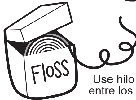
Use hilo dental entre los dientes