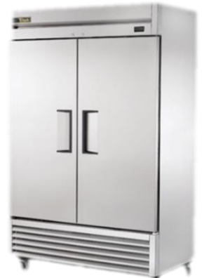
Tủ lạnh để tiếp cận