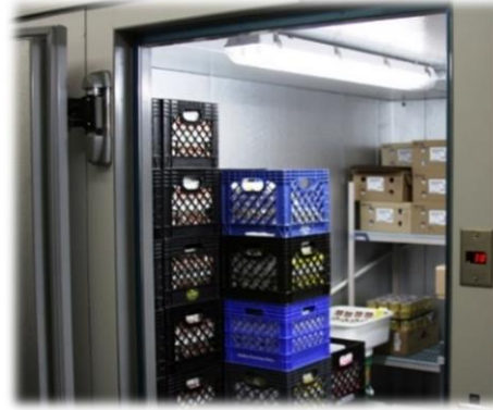
Tủ lạnh cỡ lớn

Làm nguội ngay chảo sâu 2 inch không đáy nắp có thức ăn nấu chưa chín trong: