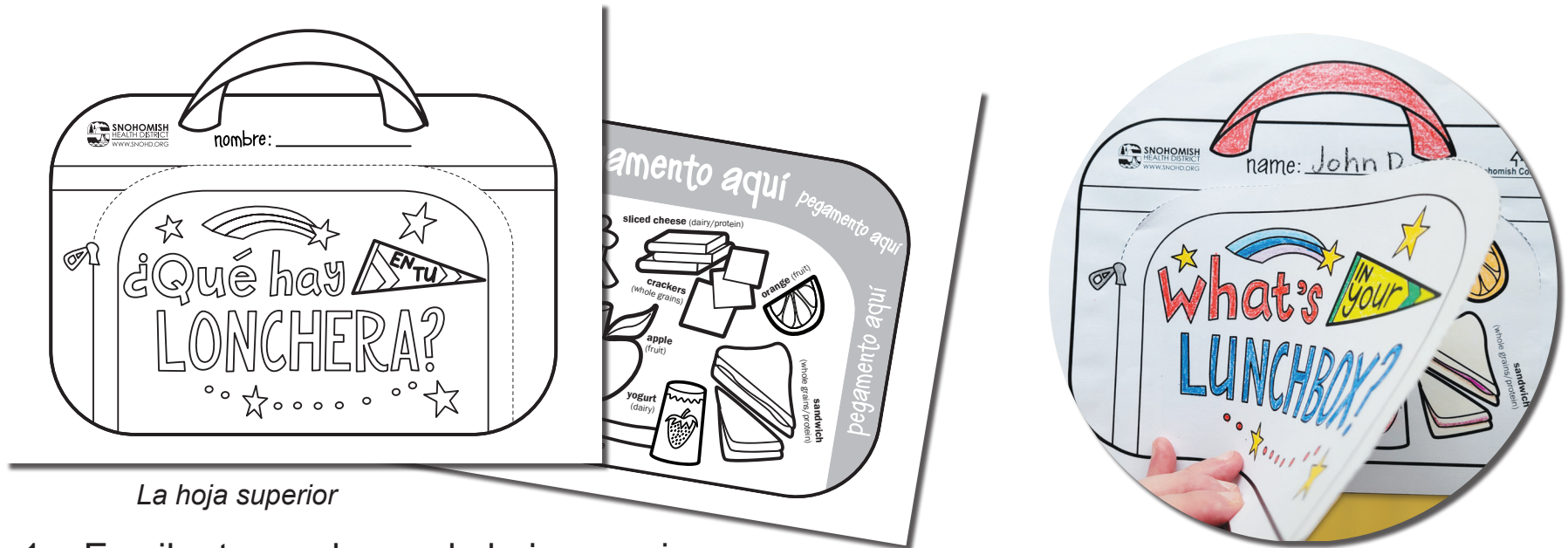
La hoja superior

Sigue las instrucciones a continuación y haz tu propia lonchera de juguete.