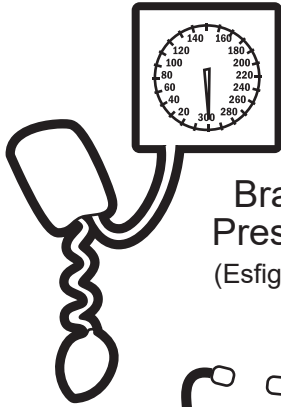
Brazalete de Presión Arterial (Esfigmomanómetro)